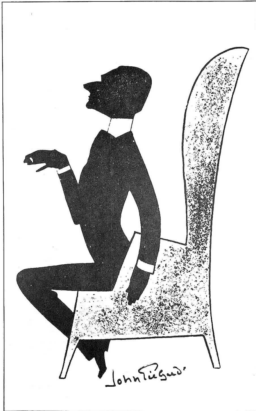
John Worthing in The Importance of Being Earnest , Globe, 1940.